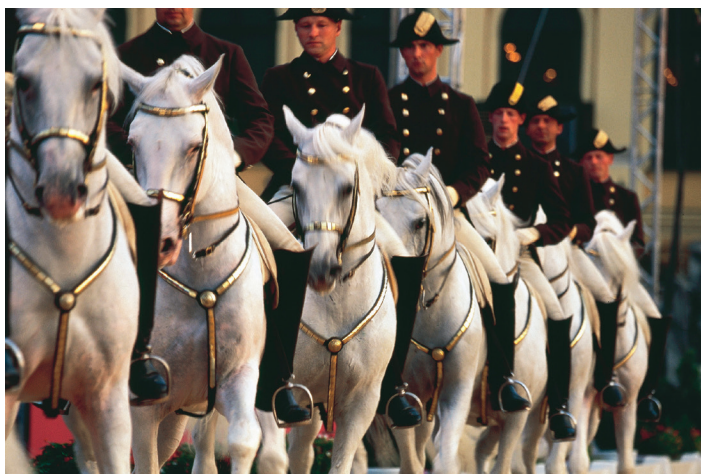
Spanska ridskolan, Wien.

Vi njuter av frukostbuffén före ankomsten till Göteborg. När alla är på plats i bussen börjar vår resa mot våra avstigningsorter med rast efter vägen.