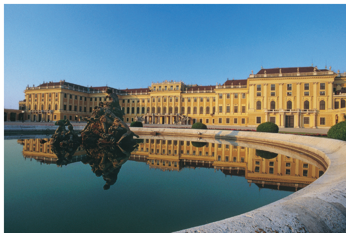
Schönbrunn slott, Wien.